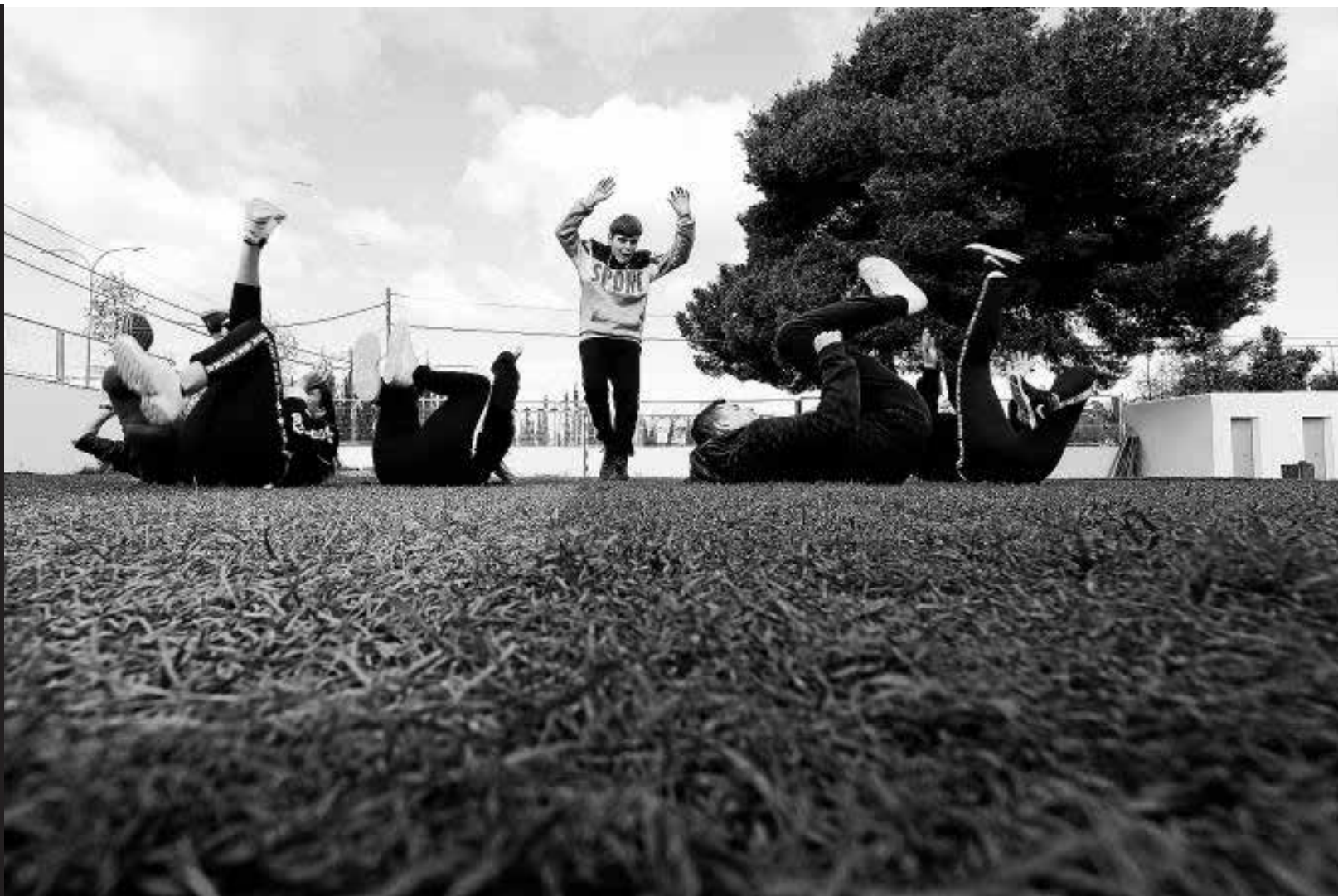
El final de un baile durante la clase de Educación Física sobre el césped artificial de la pista de fútbol sala.

Este instituto de Vila ha reutilizado el césped artificial de los campos de fútbol de Can Misses y Puig d'en Valls para renovar el pavimento de la pista de fútbol y otros espacios de este centro educativo.