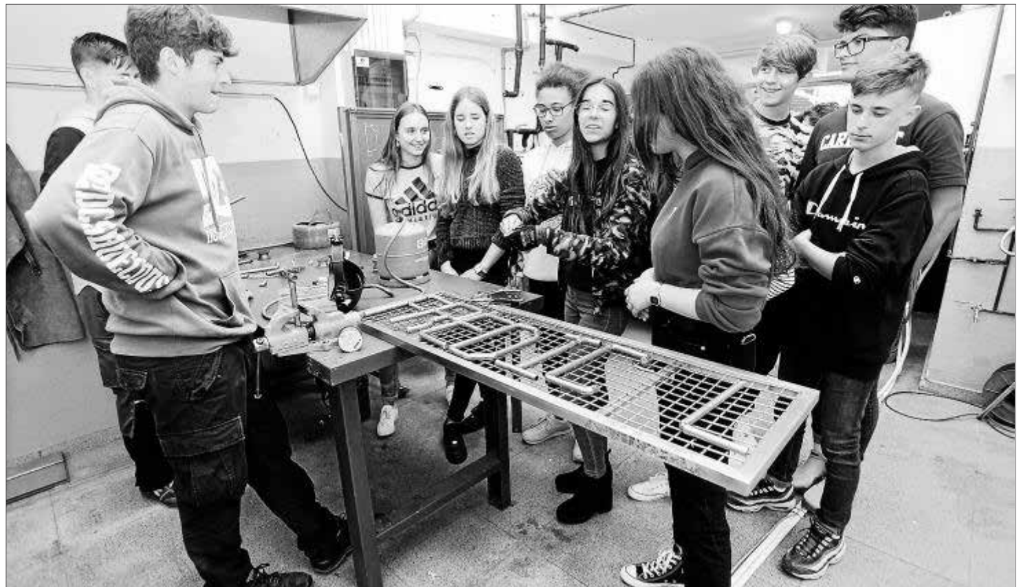
Alumnos y profesores de FP del IES Isidor Macabich recibieron a otros estudiantes para enseñarles sus talleres y aulas.

Esta formación cuenta este curso con unos 170 alumnos, una cifra baja según su jefe de estudios, Antonio Palacios. «Si tuviéramos el doble de alumnos podríamos colocar a todos los que quisieran empezar a trabajar», aseguró Palacios.