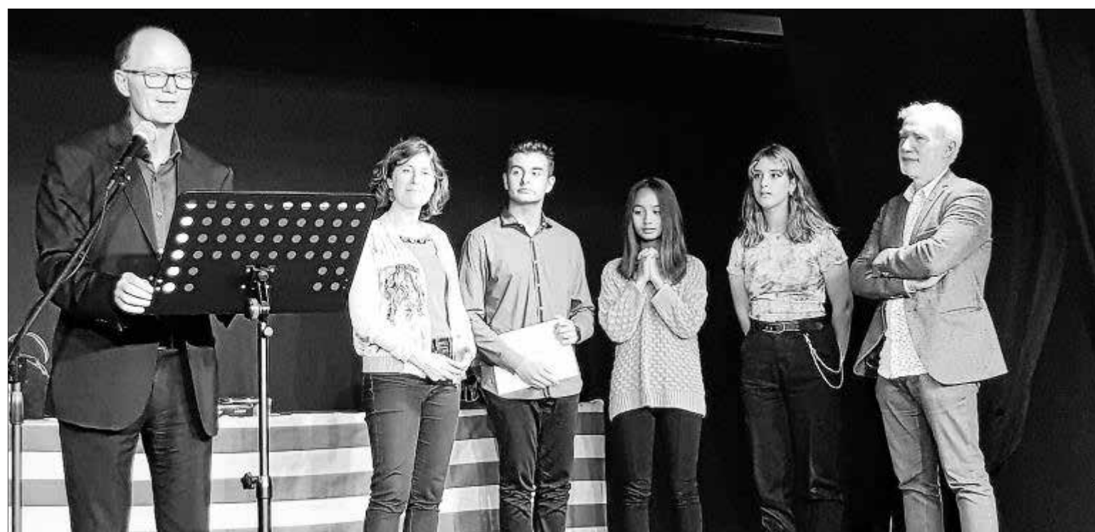
Dos momentos de la entrega de premios que se desarrolló la semana pasada en Mallorca.