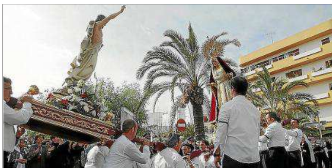
La procesión del Santo Encuentro de Santa Eulària es una de las más seguidas de la Semana Santa en la isla de Eivissa.